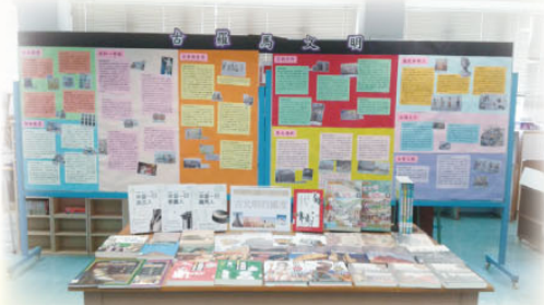
「古羅馬文明及古文明的國度」展覽