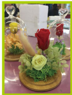
保鮮花花瓶製作—可留著鮮花的美態