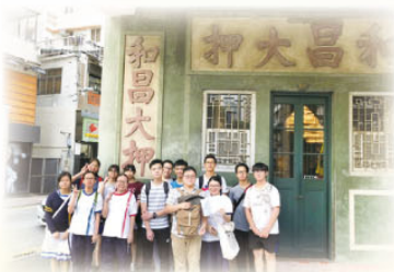
文學散步—師生在和昌大押前留影

6月19日，由中文科老師帶領10位中三至中四同學到灣仔區進行文學散步活動。同學在老師帶領下，遊歷灣仔區一些具有文學足跡的景點，包括六國酒店、太原街、春園街、和昌大押等，同時同學須閱讀有關景物的文學作品。透過此活動，讓同學更深入體會文學作品的情意。