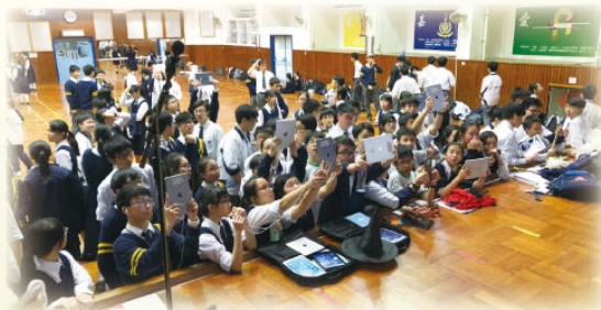
Our detectives using iPads and AR to look for the murderer

The first ever TTC Murder Mystery for junior form students was held in March 2018. 38 teams of highly energetic participants ran all over the school to look for clues (in the form of QR codes and AR traces) so as to pin down the murderer as well as discover the victim. The use of information technology in this activity was key to its unprecedented success. English Prefects, with the help of all English teachers, served as emcees and co-ordinators to ensure smooth implementation.