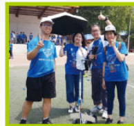
在西安親自製作微型火箭發射