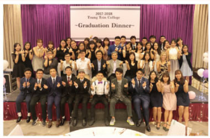
謝師宴——6D班師生合照

本校中六畢業同學於6月6日假港島君綽海逸酒店舉行謝師晚宴，師生共155人參加，大家聚首一堂，共渡歡樂時光。