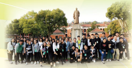
湖北學術交流團戶外留影