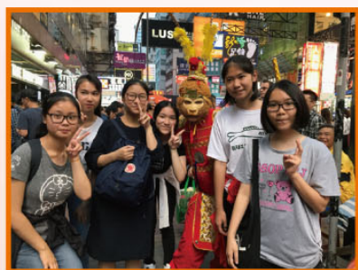
派完飯，我們在旺角遇上孫悟空啊！