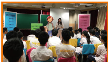
性教育——中一及中四齊參與

於試後活動推行中一及中四級性教育工作坊（與輔導組合作），由護苗基金提供每班1.5小時的工作坊，合共8節。