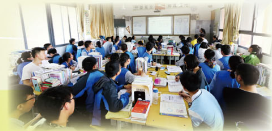
湖北學術交流團上課情況

通識科與人文社商學習領域於復活節期間合辦了「湖北五天學術交流團」，學生於是次活動中能夠更認識中國近年經濟的發展及文化保育的情況。