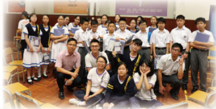
中一同學參與橋樑課程活動