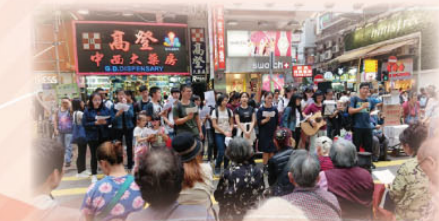
社會服務及街頭佈道

本組與德民組於4月至6月期間，參與旺角街頭送暖行動及福音佈道活動，學生藉此增加個人面對群眾的自信心，並從中學習關心社群的身心靈需要。