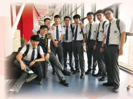
這校舍設計嶄新，空間寬敞，設備先進！ 令大家留連忘返！