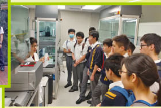
大學研究員向同學講解高級科學儀器在科研上的應用