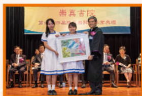
畢業班代表致送紀念品