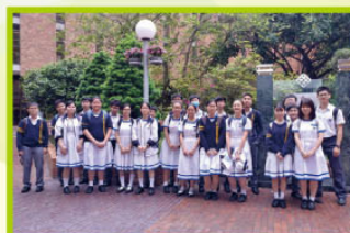
同學在理工大學留影

2018年4月25日，本校修讀化學科的同學參觀理工大學應用科學及紡織學院，期間參與了科學講座及參觀實驗室，認識尖端的科研課題及儀器。