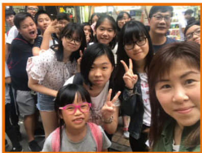
獻詩前，大家笑笑，望望鏡頭。

與宗教組合作一起舉辦「旺角街頭派飯」，在人潮如鯽的行人專用區上獻詩、分享見證及與遊人玩遊戲。同時，亦服侍一班青年歸主協會中的長者，彼此支持，傳揚福音，非常溫暖。