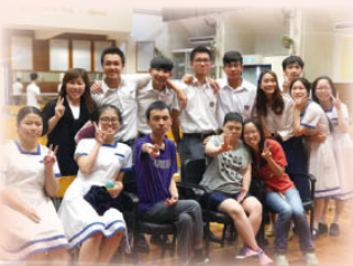
參與籌劃服務學習計劃結業禮的同學，各盡本份，施展渾身解數。

與鄰近的社會福利機構建立友好關係，促進共融和諧的社區圈。11月，本校中四級學生到訪「扶康會柔莊之家」及參觀「山景成人訓練中心」。學生了解到院舍朋友的才能和工作能力，他們在職員的指導和培訓下，亦能外出工作，投入社群。四月份，本組與宗教科合作，推行【中四服務學習計劃 Service-Learning Scheme】，聯繫扶康會，透過課程設計及結集經驗學習，讓中四級學生接觸社區，參與扶康會屬會服務，明白每一個人的生命皆寶貴，應該彼此守望相助，關心他人，亦珍惜自己的生命。