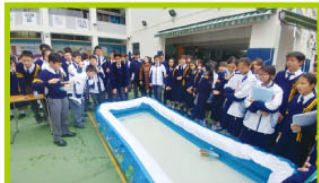
中一非電動船比賽