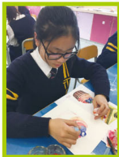
同學專心去練習水彩畫呀！

視藝學會加入了不少潮流手作工作坊，包括：橡皮印章海報製作班、皮革手繩製作班、水彩繪畫班、滴彩瓷杯製作班、迷你懷舊模型盒製作班。會員在活動中表現投入，樂在其中。