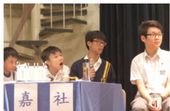
社際通識問答比賽

通識科與課外活動組合辦了「社際通識問答比賽」及「高中級辯論比賽」。學生投入，比賽在緊張熱烈氣氛中完成。