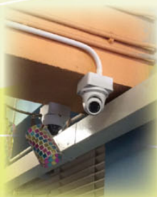
二樓的閉路電視安裝位置