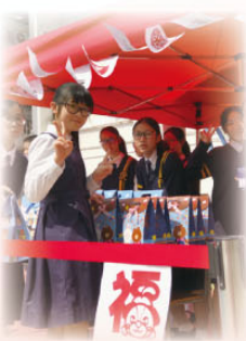
過來揀過來買吧！ 為慈善出一分力呢！

配合崇真會社會服務部的「蒙福紅包」籌款活動，農曆年假期後，本組動員二十多位理想崇真人一起籌備福袋義賣活動，呼籲老師無私地捐贈物品及糖果，集腋成裘，以福袋形式募捐，又向師生募集紅包，活動共籌得 $6,008。