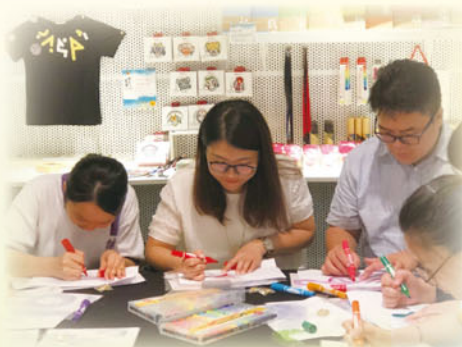
師生在「活字生香——漢字文化體驗」中製作皮影戲偶