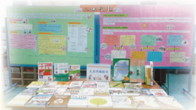
圖書館專題——「人口老化」展覽

與圖書館合作，中四級於2018年5月進行健康時事議題專題研習，讓學生能透過閱讀探究解決人口老化問題的方法；並透過分享閱讀後反思，分享「長者及年齡友善城市」如何對應世界衛生組織（世衛）提出的積極樂齡年概念。