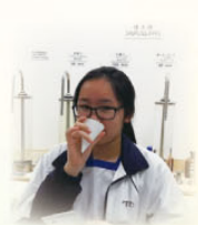
同學試飲經過濾後的食水

1B班於2018年5月10日，利用多元學習堂前往馬鞍山濾水廠參觀，從實際環境中學習課程中有關食水處理的知識。