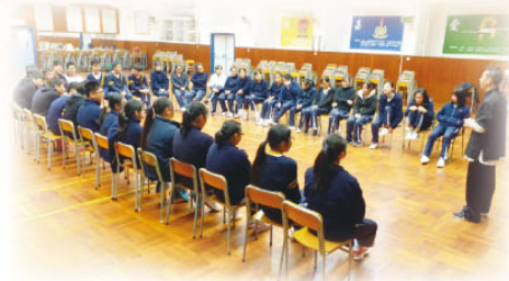
學生全神貫注地聽黃師傅

為中五級舉辦「黃師傅減壓工作坊」，讓學生了解壓力的來源、徵狀及處理方法，同時教授鬆弛壓力的方法。