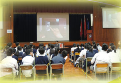
嘉賓向同學介紹書展好書