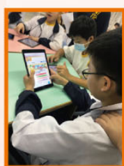
中一級網上水果 常識問答挑戰站

由4位族長及1位同學撰寫「開心『果』月」-校園水果推廣計劃，計劃書成功申請衛生署2000元活動資助。於2018年4月舉行開心果日，包括中一級網上水果常識問答挑戰站、中二級水果拼盤比賽、全校師生教職員享用水果等活動。