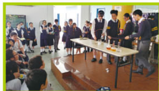
中四學生示範乾冰的實驗

2018年2月26日至3月5日為本校的數理科技周，除有多個由高中學生主持的科學活動供初中學生參與外，還有各項科學比賽，讓全校師生感受科學的趣味。