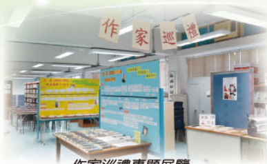
作家巡禮專題展覽

圖書館與不同的學科合作，舉辦多個專題展覽，包括作家巡禮專題展覽、「數理偉人故事」專題展覽、1819 財政預算案展覽、「古羅馬文明及古文明的國度」展覽及「人口老化」專題展覽，以推動學生從閱讀中學習。