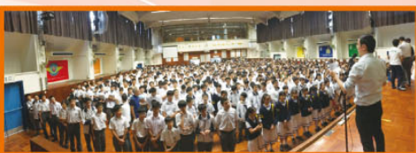
首次於學校禮堂進行防火演習

由於上年期小食部失火，揭露了以往防火演習的漏洞，故此訓導組在下學年的防火演習採取了新的路線，並制定了多個後備方案及路線。