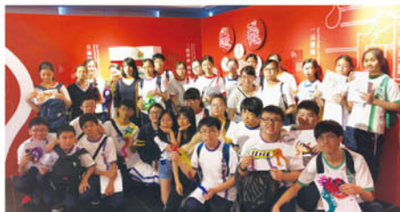
同學出席「活字生香——漢字文化體驗」活動大合照

6月26日試後活動期間，30名中一至中五同學到饒宗頤文化館參加「活字生香——漢字的世界 世界的漢字」漢字文化體驗活動。是次活動，同學除了參觀漢字文化展覽導賞，亦親手製作皮影戲偶。讓同學從中認識到中國文字之美，也有機會親身參與製作中國藝術品。