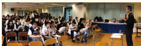
Our debating contest