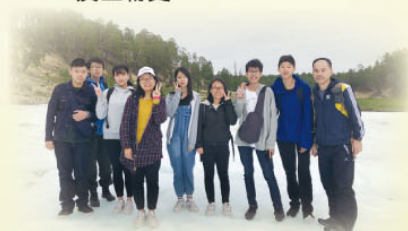
同學在西伯利亞冰川留影

2018年7月20日至8月3日(共15日)，一批中四及中五之理科同學，參加由崇真會與俄羅斯薩哈共和國教育部聯合舉辦的俄羅斯西伯利亞考察團，以了解西伯利亞的地理及生物史。