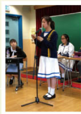
Our S1 debater in a friendly contest against Tuen Mun Catholic Secondary School

The English Debating Team engaged in various contests to hone their debating skills. The Team participated in The HKPTU English Debating Competition, and earned valuable experience. Exhibition contests were held within the debate team and with different schools. During the post-exam period, an innovative "triangular debate", in which teachers, senior students and junior students debated against one another, was staged, and the junior students were crowned victorious in the end.