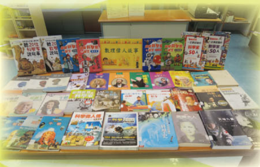
「數理偉人故事」專題展覽