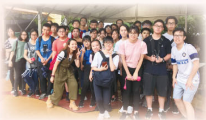
海洋公園 3D 遊