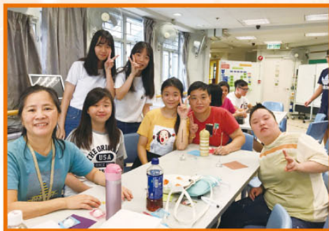
中四服務學習計劃就是以愛行善，讓身邊的人感到溫暖！

所有高中班級均設一位升學輔導老師，以向同學提供有關升學及就業的諮詢支援。老師借通識課教授生涯規劃的知識和技巧，目的在於讓同學認識文憑試，反思學習，思考畢業後出路，及認識大學課程及其收生準則，檢視自己，進一步計劃畢業後的進修及發展個人抱負。