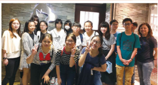
參觀寵物美容中心

本校與循理會屯門青少年綜合服務中心合作，於4月23日，帶領部份中三、中四同學參觀寵物美容中心，了解該行業的工作性質及就業前景。