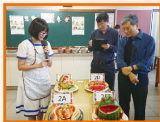
中二級同學闡述水果拼盤的營養價值