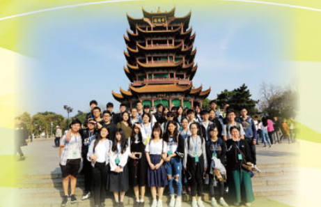
武漢黃鶴樓前合照