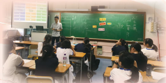
中三同學與導師互動學習濫藥知識

於2018年3月參與LEAP生活教育活動計劃的藥物教育課程，中三級透過健康管理與社會關懷課學習藥物知識（冰及K仔）、朋輩壓力、娛樂場所的安全意識及拒絕技巧的主題。