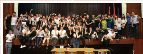
台前幕後全體人員