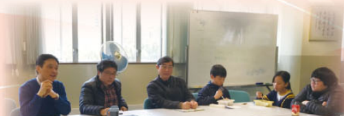
學生議會——校長飯局

為了解同學的學習情況及其需要，校方定期舉行校長飯局，邀請各班代表出席，與正、副校長共晉午餐，並在活動中向校方反映意見。校長飯局全年共舉行四次。