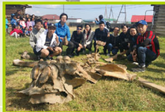
同學實地認識史前生物 - 西伯利亞長毛象