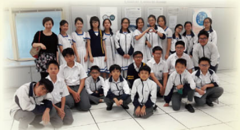
1B班同學在濾水廠留影