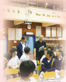
老師與講員進行互動活動

輔導組成功向優質教育基金申請撥款，向學生提供有系統的情緒健康課程及活動。1月26日及3月13日的「情緒非常任務」實踐課 (I) 及 (II)，讓學生透過課堂練習學習以「不傷自己，不傷他人」的原則與情緒共處。3月1日開始「友晴同盟—自我探索」小組，目的是透過多元創作及敘事手法、桌上遊戲、情境預演及應對訓練，幫助學生自我探索，促進社交思考的能力，提升調適的效能，學習與情緒共處，建立健康生活模式，減低壓力，藉小組於校園推廣抗逆文化，建立和諧友愛的校園生活。5月23日舉行「情緒健康由我做起」講座，讓同學反思及察覺個人情緒狀態，並學習疏導情緒的方法。