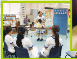
「小說欣賞」好書分享會

為推廣閱讀風氣，圖書館邀請中三至中五同學擔任閱讀大使，為中一同學統籌以「小說欣賞」、「人物傳記」及「各行各業」為題的好書分享會。閱讀大使會據主題選取好書於分享會以輕鬆有趣的方式作分享，增加同學對該題材的閱讀興趣，從而借閱相關的圖書。另外，圖書館為中二同學安排了 1 次聚會式分享會，由閱讀大使帶領參加者分享人物傳記。