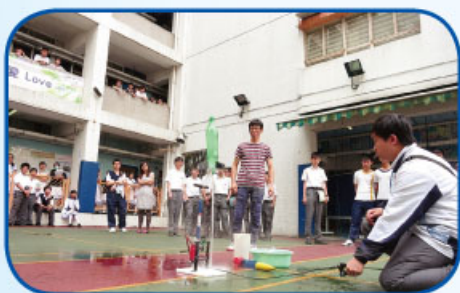
看誰設計和製作的水火箭飛得又高又遠

2014 年 5 月 13 日為由理科聯科學辦的科學日，當日小息、午膳及放學時間都安排了精彩的科學活動供全校學生參與，如水火箭比賽、乾冰實驗、解剖老鼠、科學電影欣賞等，氣氛相當熱鬧。