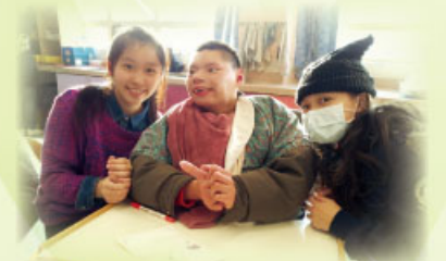
本校中四同學邀請「扶康會」的朋友蒞臨崇真書院，一起歡渡農曆新年。

【中四服務學習計劃 Service-Learning Scheme】課程：今年主題為「天生我才必有用」，透過課程讓學生明白神愛每一個人，造就每一個人，教導學生發掘自己才華，同時亦要欣賞他人。本組邀請到「扶康會潔康之家」合作舉行計劃，為中度至嚴重智障及身體殘疾人士提供服務，學生需學習推輪椅及攙扶服務對象。整體而言，遊戲設計配合他們能力，氣氛良好。