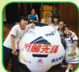
同學與大型充氣足球合照

為了協助青少年了解賭博的性質、解開賭博迷思、提升抗賭意識及能力，本組與「香港東華三院平和坊」合作，在7月2日的試後活動推行互動講座，透過輕鬆有趣的手法向學生灌輸抗賭意識。