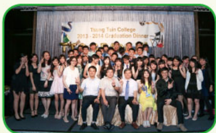
正副校長、班主任與 S.6D 班合照

本校中六畢業同學於6月17日假旺角帝京酒店舉行畢業聚餐，出席師生超過200人，當晚師生聚首一堂，共渡歡愉時光。