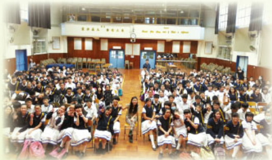
精神大使賴恩慈小姐分享完畢後與同學大合照

本組於4月29日邀請2013香港精神大使賴恩慈小姐，向中一及中二級學生分享個人經歷。透過賴小姐在寄養家庭下成長，仍然堅持自己理想，在舞台上發熱發亮。藉以激勵學生無論處於任何環境，都要堅持心中理想。