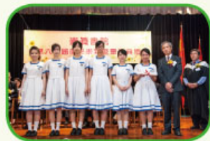
主禮嘉賓頒發畢業證書與中六畢業生