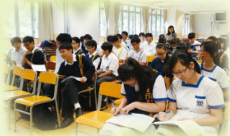
學生議員全情投入議會會議

本年度學生議會會議已於2014年5月14日舉行，議員對對學生培育、學校政策及其他方面作出提問。當中主要以建議校方多舉辦班際比賽、允許同學提議週會嘉賓、建議校方在寒冷天氣警告生效時，批准同學在課室用膳、改善拍卡制度、定期檢查當天午餐食物質素等作出討論。校方已回應各提問，各班議員將於班上報告校方的回應。