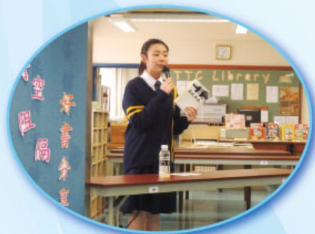
閱讀大使分享好書

圖書館於下學期舉辦「超越時空阻隔好書分享會」及「破解你的『心』好書分享會」，安排閱讀大使分別就有關歷史、旅遊、各地風貌，以及心理書籍兩大主題，以輕鬆有趣的方式，向參加者推介圖書館的館藏，增加同學對不同範疇圖書的閱讀興趣。