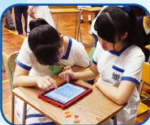
English Word Champion - iPad games