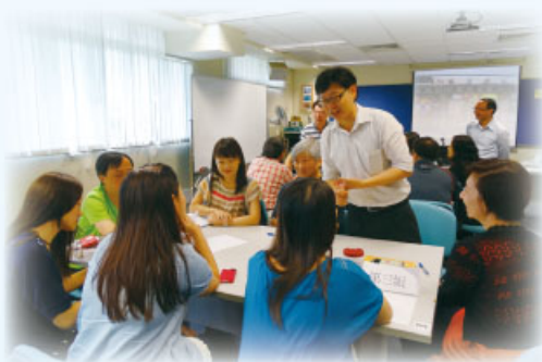
老師們在工作坊中投入討論