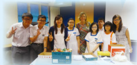
LAC Activities - the teachers and English Prefects