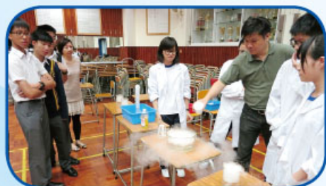
由乾冰製作出來的奇異效果吸引了不少同學的目光