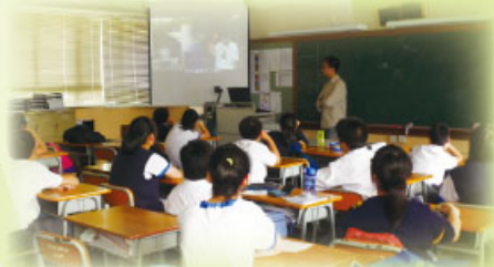
學生聚精會神觀看教育影片

本組邀請「明愛容園」在一月及四月為中二及中三級舉辦「情 • 感 — 健康情緒教育」工作坊。目的讓學生認識及嘗試理解自己內在情緒的狀態，學習管理情緒的方法，減少壓力及負面情感之產生。