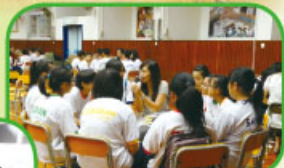
初中團契分組活動