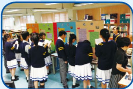
同學參觀作家巡禮展覽

為了增加同學對香港及台灣作家的認識，鼓勵同學多閱讀名家作品及好書、培養閱讀習慣，以及讓同學從閱讀中提升閱讀及寫作能力，圖書館與中文科合作舉辦作家巡禮協作活動－作家講座及當代作家介紹專題展覽。