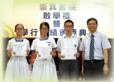
「理想崇真人獎學金」獲獎同學與黎校長合照