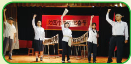
參與演出「六四舞台」的同學全情投入，演活了二十多年前國內爭取民主青年的角色。