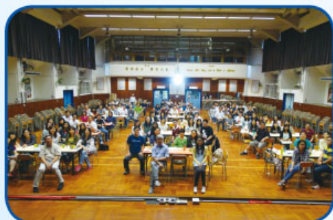
「聯校退修及教師發展日」，兩校老師大合照