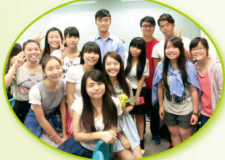
本校學生與區內其他參與學生於活動嘉許禮中合照

5. 暑假期間，本校6名中四級及中五級修讀「健康管理與社會關懷科」的同學，參加「屯門醫院陽光天使義工服務計劃」，經過屯門醫院的醫生、護士及社工培訓，於院內設計健康推廣活動予病者，學習關心病者的需要。