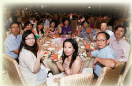
老師為應屆中六同學畢業而乾杯