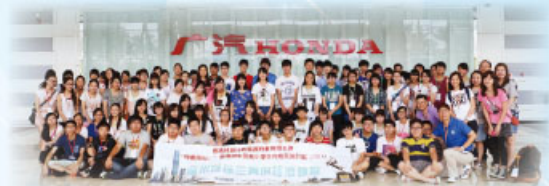
本校同學參觀廣州本田車廠

本校地理科於 2014 年 7 月 8 日至 9 日，安排同學參加由「港京管理人才中心」主辦的「珠江三角洲經濟發展考察團」，共有七十六位師生參加。兩日一夜的行程，先後參觀廣州本田車廠、廣州交通科技學院及神農草堂中藥園。