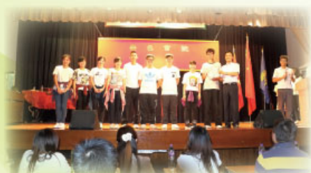
社際天才表演頒獎時刻

一年一度天才表演於7月3日舉行，當天有社際及團體形式比賽，各社盡派精英參加，最後冠軍為嘉社；亞軍為愛社；季軍為信社。