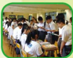
舊書買賣活動 - 價高者得

本年舊書買賣活動已於2014年6月30日、7月3日及7月12日舉行，學生及家長積極參與，過程順利。