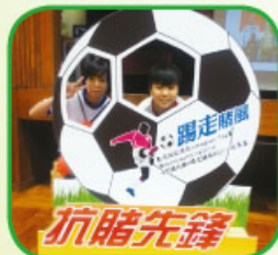
同學在足球佈景板後拍照