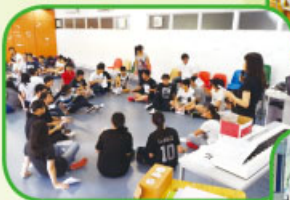
信仰成長營分組活動