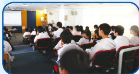
LAC Activities - the movie session

A science class was open for class visit on 22/5 to facilitate professional development on the front of effective language use in content-subject teaching. A post-visit conference was held, positive feedback was received, and teaching ideas were exchanged.