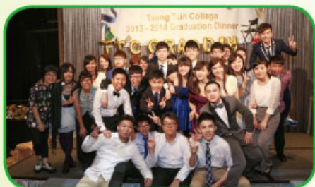
應屆中六畢業同學合照