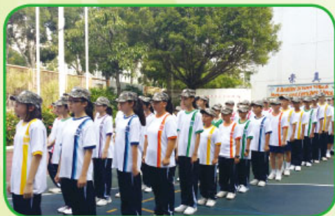
中一同學在操場集隊，參加「升中適應講課程」。

為了讓中一同學盡快適應中學生活，並強化他們的學習基礎，本校於8月25日至29日期間，舉行「中一橋樑課程」，所有中一新同學必須出席。橋樑課程舉行期間，中一新生須參加英文課程，以提升其英語水平；同時，透過各科組主辦的講座及活動，使中一新同學對本校的歷史及校園生活各方面的情況均有所認識，並漸而建立他們對學校的歸屬感。