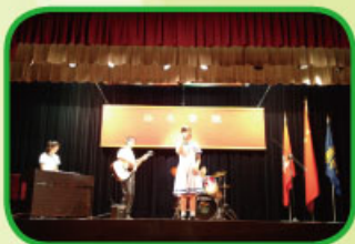
參賽同學正施展多方面的才華

本年度天才表演已於2014年7月3日舉行。學生運用多種類的樂器、戲劇、舞蹈等參賽，氣氛良好。