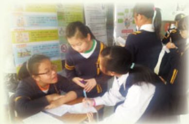
受訓的健康家族向同學解釋成癮問題的資訊

4. 本校10名「健康家族」的會員於5月10日到保良局方王錦全小學參與活動日，為小學設計及製作攤位，藉攤位遊戲教導同學良好溝通的技巧，推廣健康訊息。