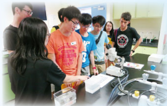
同學正聆聽大學職員講解實驗示範

2014年7月3日一批化學科學生參觀了浸會大學理學院，當天除觀看了多個實驗示範外，亦參與了由浸大化學系教授主講、名為「晶彩未來」的講座。