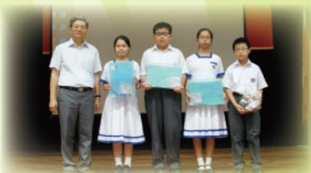
在橋樑課程中表現優異的中一同學獲頒發禮物