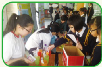
健康家族同學主持攤位遊戲，讓同學認識成癮的害處

3. 3月25日至4月4日期間，「香港青年協會青年全健中心」的社工帶領8名健康家族的會員製作成癮問題攤位，藉展板的資訊及攤位遊戲讓同學認識成癮問題的影響和預防方法。