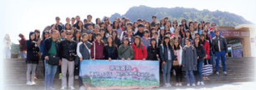
本校同學於濟洲島漢拿山國家公園合照

2014 年 4 月 13 日至 16 日，地理科舉辦「韓國濟洲自然生態考察之旅」，師生共八十四人參加。行程包括漢拿山國家公園、城山日出峰等火山作用的地貌。