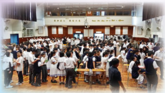
English Word Champion - a huge turnout

The Word Champion, a vocabulary competition comprising a vocabulary game circuit in which students participate in various word games to compete for the highest scores to become the word champion of the school, was held on May 8 and May 15, 2014. The turnout for this program was unprecedentedly high, with 384 participants on the first day, and 536 on the second.