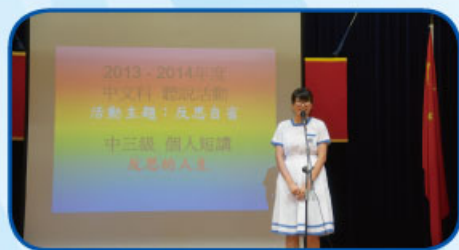
在聽說活動中同學演說的情況

在六月至七月，中文科與統一教育集團合辦「開懷釋卷」閱讀能力拔尖課程，課程共五講十小時，針對不同的文章體裁，指導學生相關的閱讀策略，共有 30 位同學完成課程。期望透過以上課程，進一步提升同學閱讀理解的能力及文憑試成績。